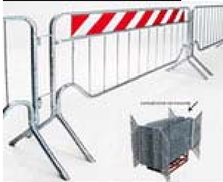
Immagine associata alla fase

Le transenne di delimitazione delle aree di lavoro su spazio pubblico verranno trasportate con apposito mezzo e scaricate nel luogo interessato dalle lavorazioni.