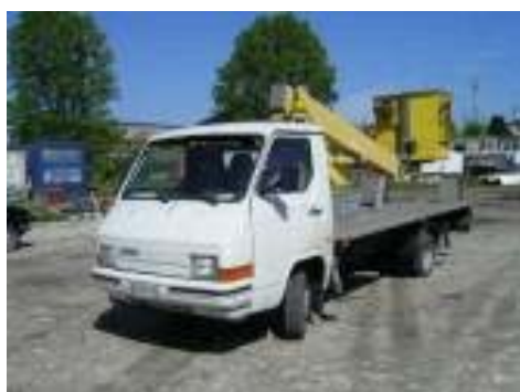
Immagine associata alla sottofase