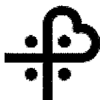
ATS SARDEGNA AZIENDA TUTELA SALUTE ASSL NUORO