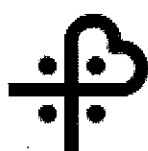
ATS SARDEGNA AZIENDA TUTELA SALUTE ASSL NUORO