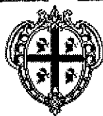
REGIONE AUTONOMA DELLA SARDEGNA